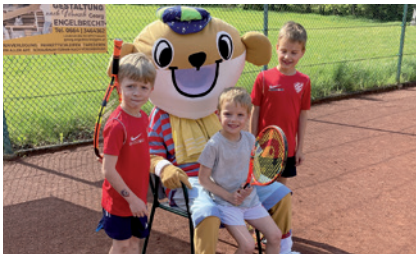
Das Maskottchen Talentino kam persönlich nach Leoben.

Von den ersten Wettkampferfahrungen junger Talente in Leoben über spannende Matches in Graz bis hin zum Relaunch des ÖTV-Kids-Gütesiegels.