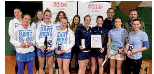
Die Finalistinnen aus Hartberg (l.) und die neuen Wintermeisterinnen aus Bruck/Mur (r.).

des TSV Hartberg nach 4 Einzelspielen ausgeglichen 2:2 standen. Die Doppel mussten entscheiden, und im Fotofinish entschied ein einziges Game im direkten Vergleich für die ESV Bruck Damen. Wir gratulieren allen Mannschaften zu den tollen Erfolgen.