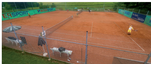
Perfekte Bedingungen für das Schülerliga Finale in Riegersburg.

Am 28. Mai 2024 fand das Landesfinale des Drei Tennis Schulcups der Unterstufen in Riegersburg und Hatzendorf statt.