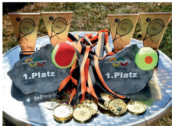
■ Es gab wieder tolle Preise für die Sieger des Vulkanland Kids & Jugendcup.

Insgesamt nahmen 62 Kinder und Jugendliche aus über 20 Vereinen an dieser beliebten Turnierserie teil, was die wachsende Begeisterung für den Tennissport in der Region eindrucksvoll unterstreicht. Der Vulkanland Kids & Jugend-Cup bleibt ein Highlight im regionalen Tenniskalender.