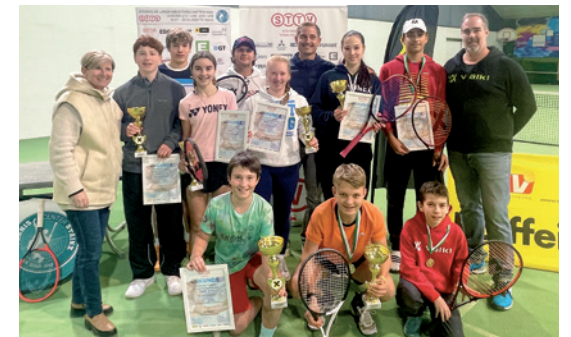
Steirische Landesmeister Halle 2024.

Talente haben gezeigt, dass sie in der Lage sind, auf hohem Niveau zu spielen und sich gegen starke Konkurrenz durchzusetzen. Mit dieser Motivation und den gesammelten Erfahrungen blicken sie optimistisch auf die kommenden Herausforderungen.