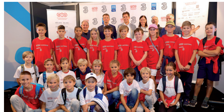
Relaunch des ÖTV Kids Gütesiegels.

regelmäßig an Fortbildungsveranstaltungen teilnehmen. Ziel ist es, ein altersgerechtes Training und einen gleichberechtigten Zugang zur Sportart Tennis für Mädchen und Burschen zu gewährleisten. Der ÖTV strebt eine langfristige Qualitätssteigerung und -sicherung im Kindertraining an, um die Kids langfristig an den Tennissport zu binden.