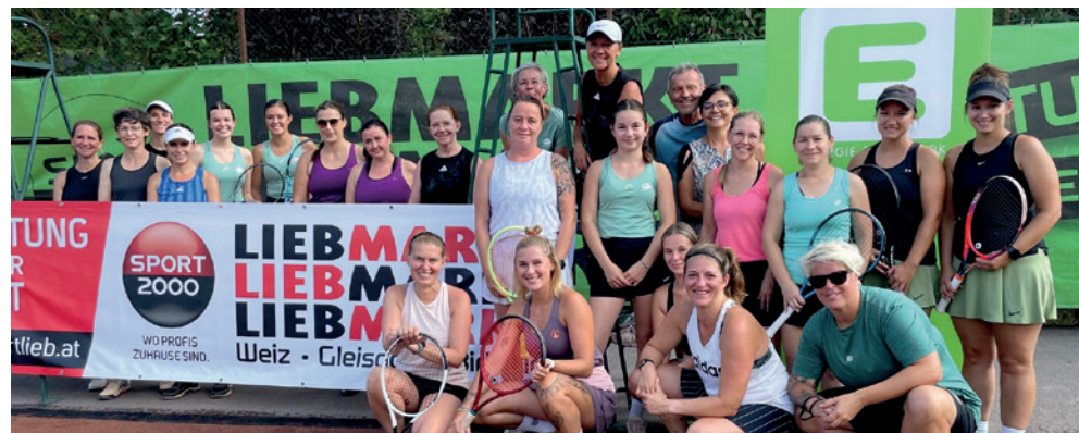
Die Ladies Double Challenge machte diesmal in Weiz halt.