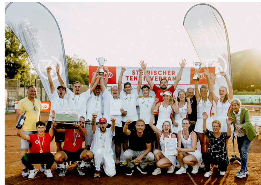
■ GAK Damen und KSV Herren holen sich den Meistertitel.

Herren den Sprung in die Bundesliga schaffen. Während die Hartbergerinnen noch im unteren PlayOff der 2. Bundesliga kämpfen, sind die Irdninger Herren auf dem besten Weg in die 1. Bundesliga. Die Tennisgemeinschaft drückt nun den GAK Damen und den KSV Herren in der kommenden Bundesliga-Aufstiegsspielen fest die Daumen.